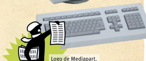
Logo de Mediapart.